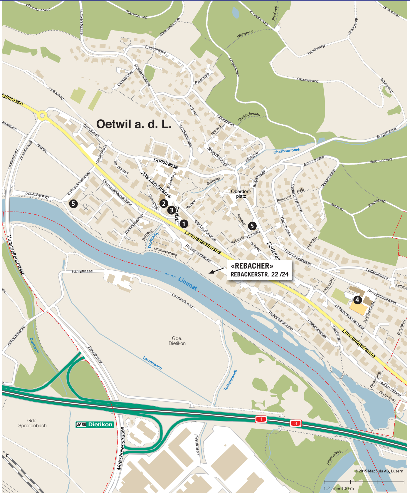
1 Bushaltestelle 2 Post 3 Gemeindehaus /Einkaufen 4 Schulhaus 5 Kindergarten